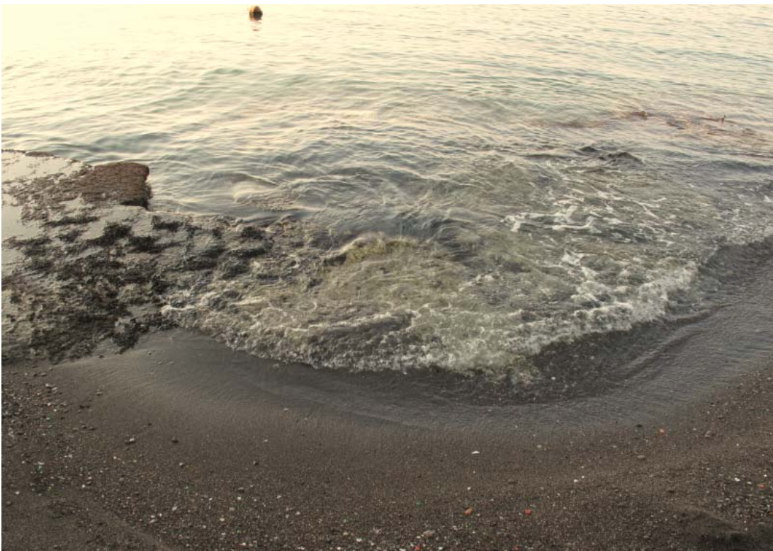
Foto 6 – Particolare del margine ovest della spiaggia c/o scalo alaggio.