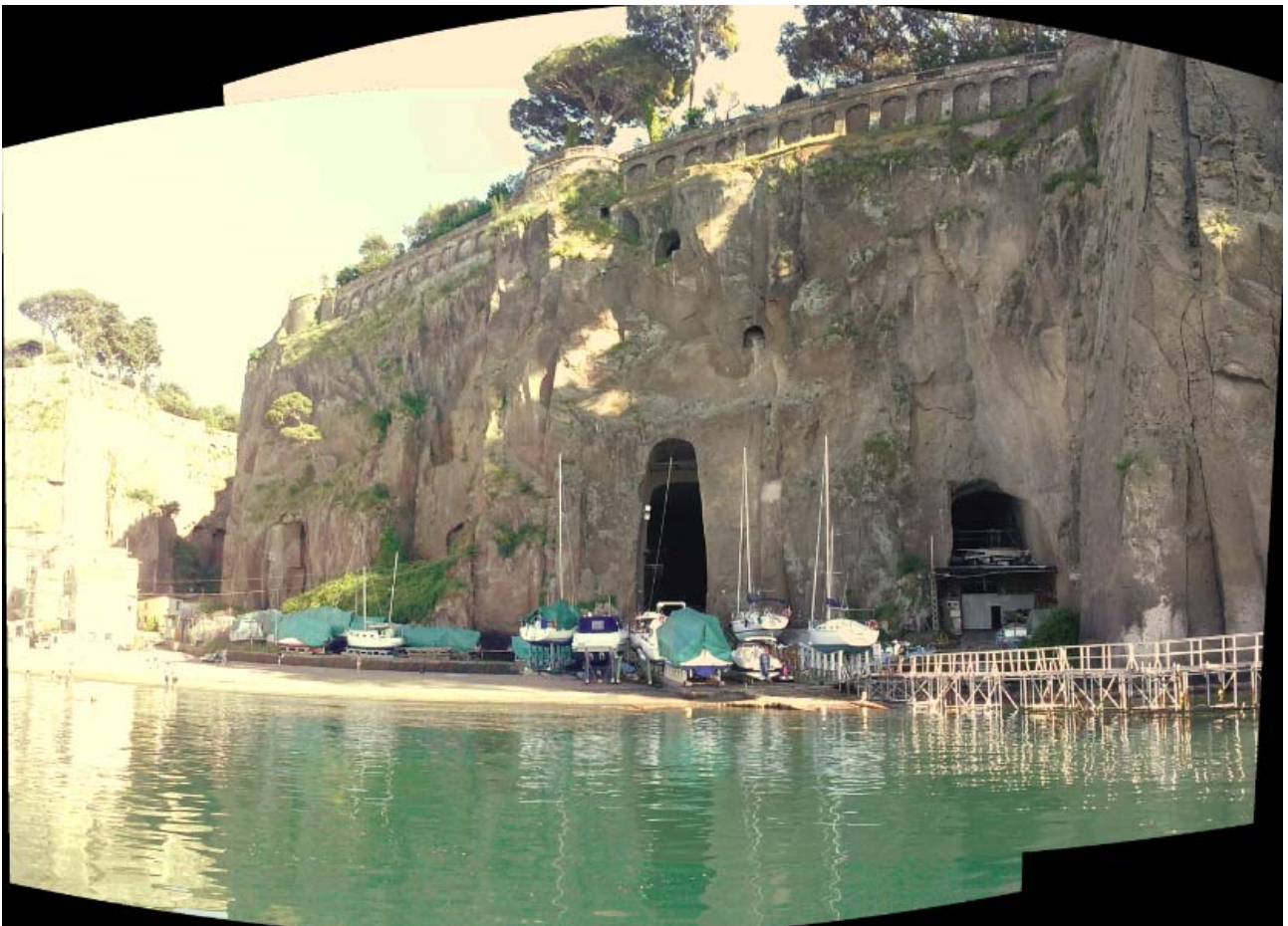
Foto 12 – Vista del costone tufaceo sovrastante gli scali di alaggio.