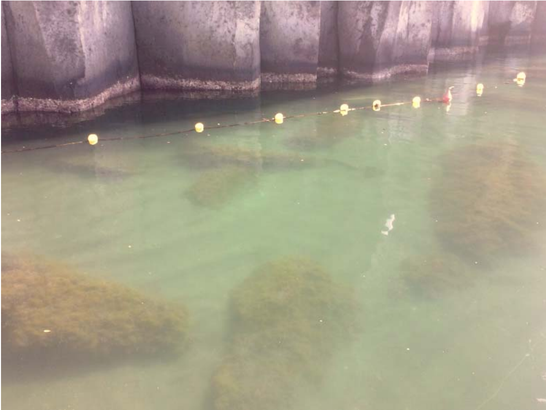
Foto 15 – Vista del piede della falesia tufacea nell'area interna alla scogliera.