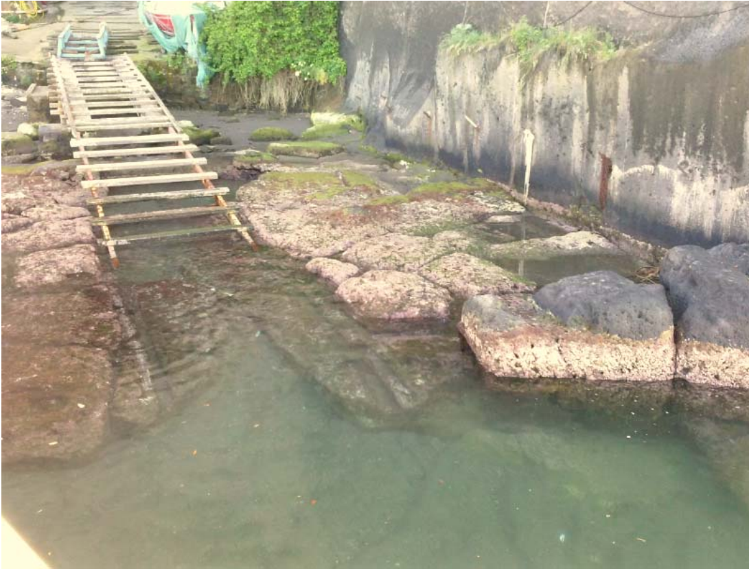
Foto 13 – Particolare dello scalo di alaggio al piede della falesia tufacea.