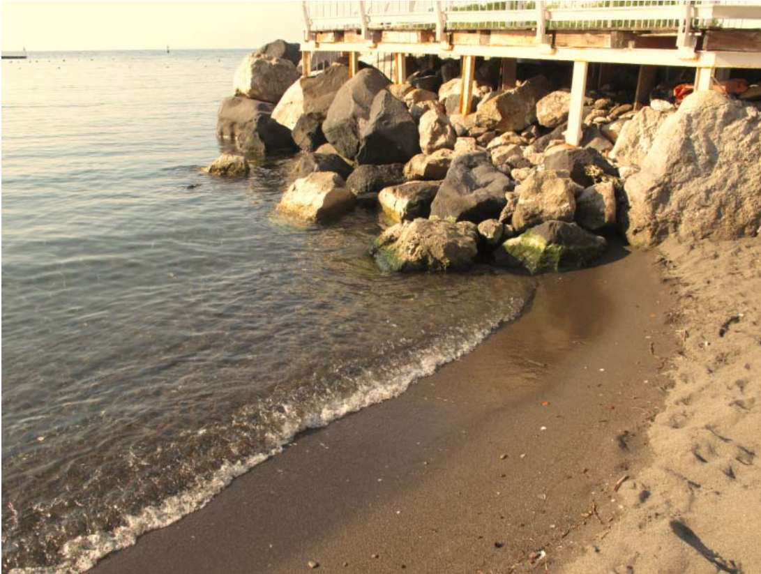
Foto 7 – Particolare del margine est della spiaggia c/o la scogliera del porto di Marina di Cassano.