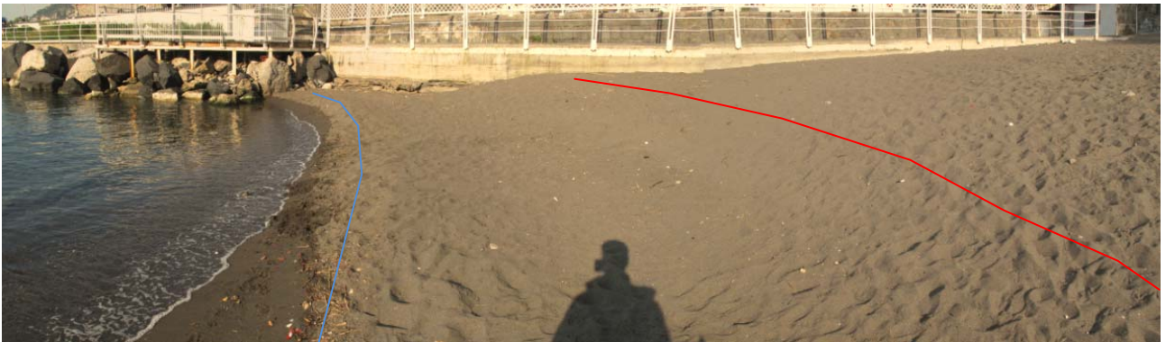
Foto 4 – Fotomosaico del fianco est della spiaggia e della linea di riva. In rosso la berma di tempesta e in azzurro quella ordinaria.