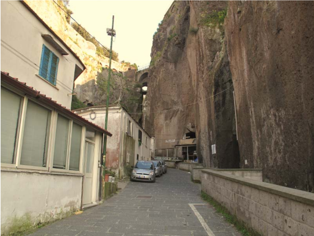
Foto 9 – Vista del tracciato del vallone S. Giuseppe a monte della spiaggia Caterina.