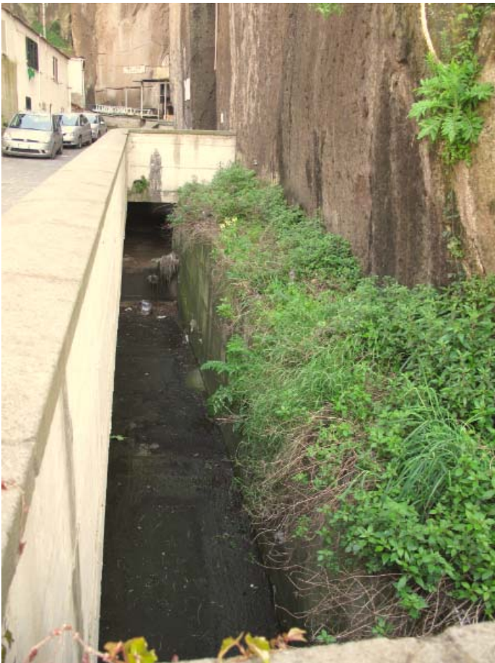
Foto 10 – Vista del canale artificiale del vallone S. Giuseppe a monte della spiaggia Caterina.