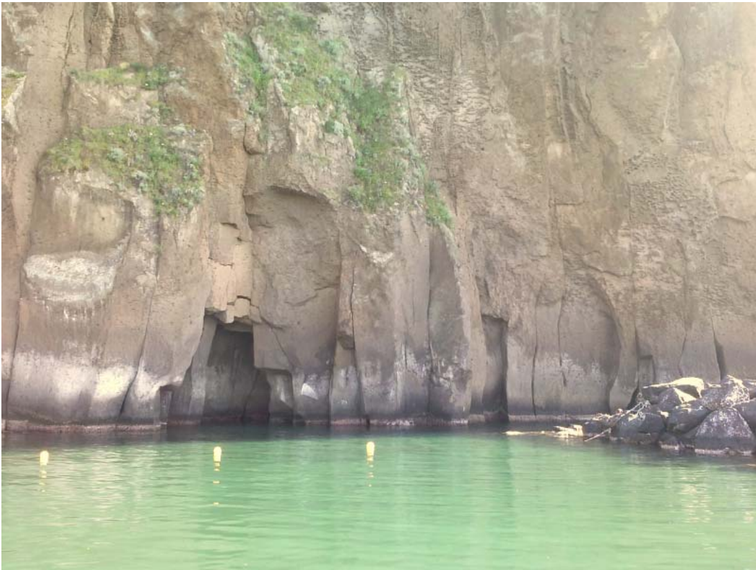
Foto 16 – Vista del tratto di costone tufaceo interno alla scogliera e grotta costiera.