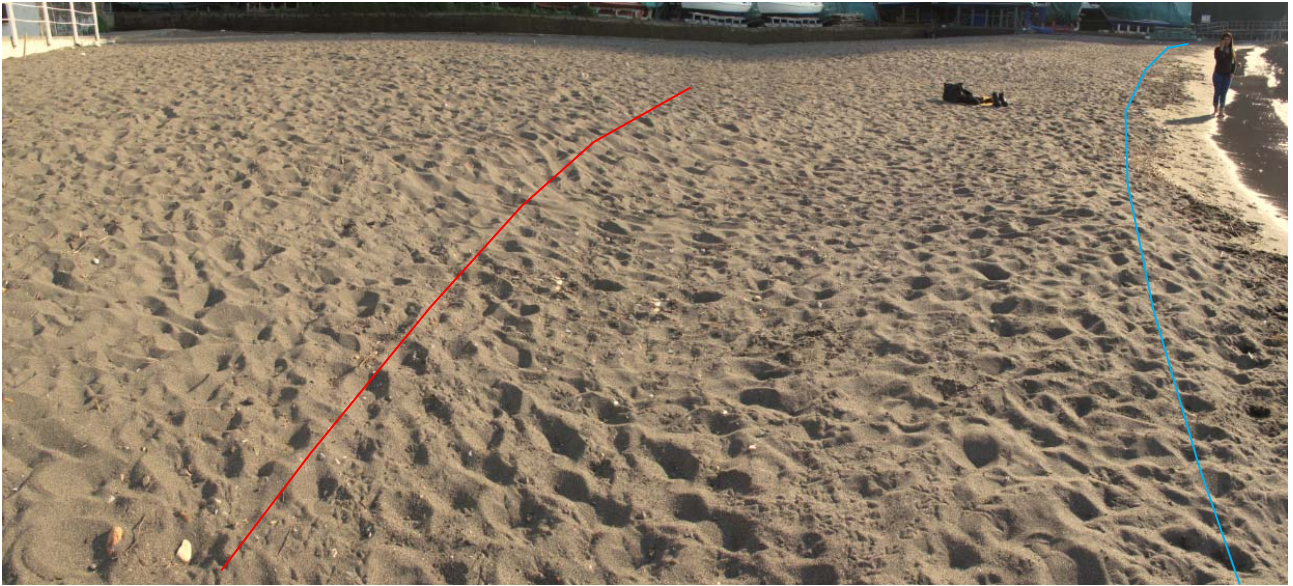
Foto 5 - Fotomosaico del fianco ovest della spiaggia e della linea di riva. In rosso la berma di tempesta e in azzurro quella ordinaria.