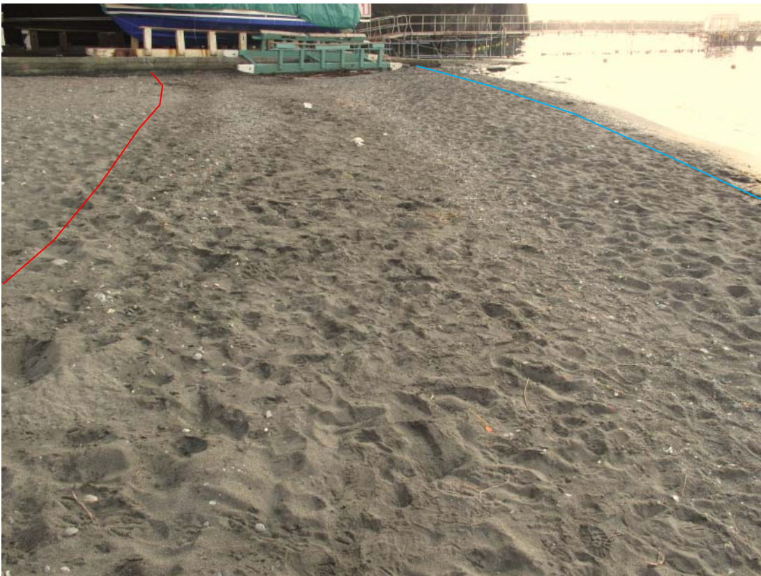
Foto 8 – Particolare del lato ovest della spiaggia. In rosso la berma di tempesta e in azzurro quella ordinaria.